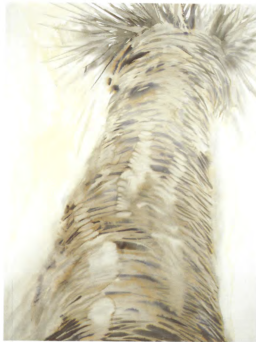
מתוך הסדרה גזעים של עצי דקל, אקוורל על נייר, 1995, 160x120 ס"מ From the series Palm Tree Trunks, 1995, watercolor on paper, 160 x 120 cm.